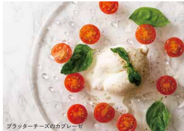
ブラッターチーズのカプレーゼ