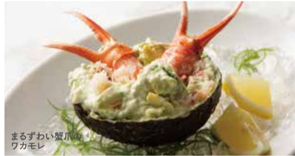
まるずわい蟹爪のワカモレ