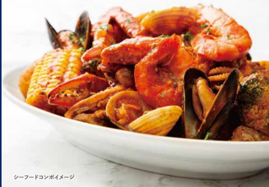
シーフードコンボイメージ

お一人様シーフード追加 +1,700 You can add seafood per one person +1,700yen