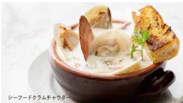
シーフードクラムチャウダー

Boston Crab Salad _____ 1,200 ボストンクラブサラダ