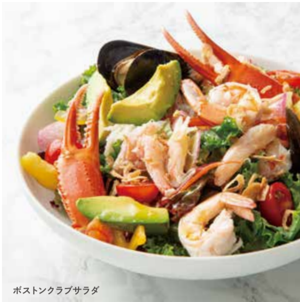
ボストンクラブサラダ