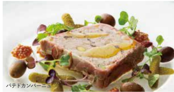
パテドカンパーニュ