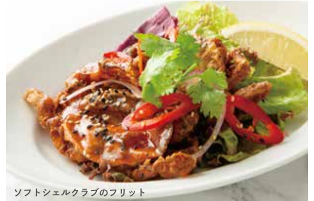
ソフトシェルクラブのフリット