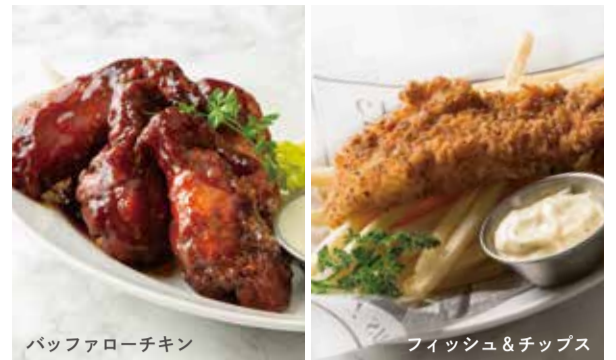
バッファローチキン