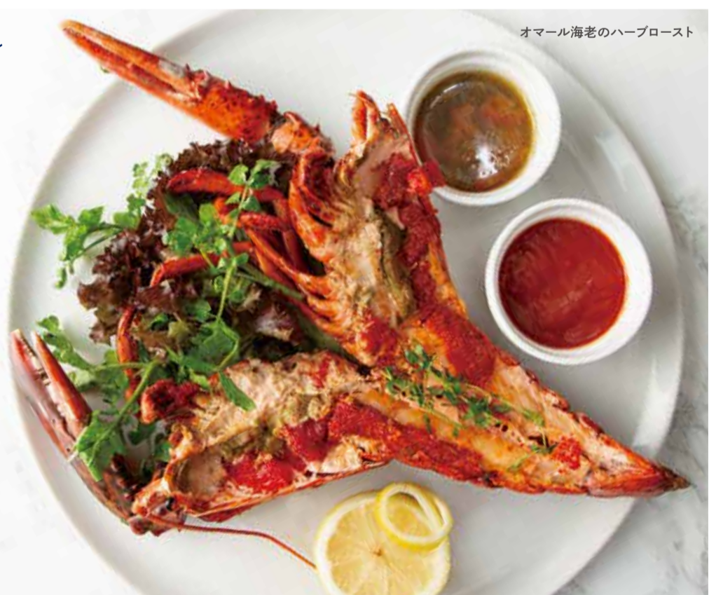
オマール海老のハーブロースト