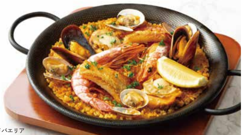
シーフードパエリア

Stone Crab Paella _____ 2,500 ストーンクラブパエリア