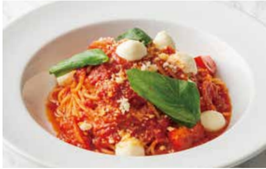
Pomodoro with Cherry Mozzarella & Basil チェリーモッツアレラとバジルのポモドーロ 1,350