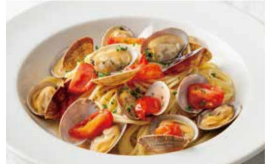
Vongole Bianco with Cherry Tomato チェリートマトのボンゴレビアンコ 1,350