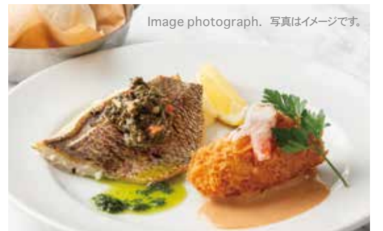
Today's Fish Plate with Bread 本日のフィッシュプレート (ブレッド付き) 1,900 Image photograph. 写真はイメージです。