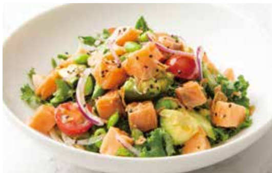
Salmon & Avocado Poke (Rice Bowl) [Soy Sauce or Salt & Ginger Sauce or Hot Spicy Sauce] サーモンとアボカドのポケ (ライスボウル) ・醤油ソース ・ソルト&ジンジャーソース ・ホットスパイスソース 1,550