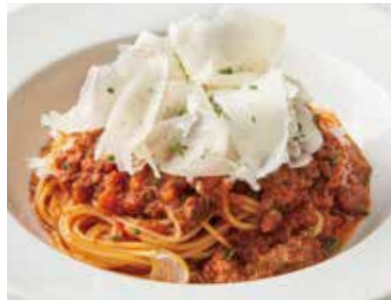
Wagyu Beef Bolognese with Raspadura Cheese 和牛とラスパドゥーラチーズのボロネーゼ 1,400