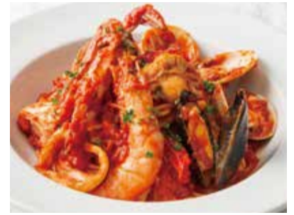
* Pescatore with 7 kinds of Seafood * 7種の魚介のペスカトーレ 1,700