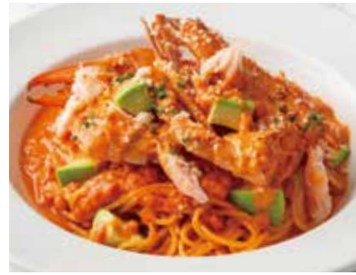
* Tomato Cream Sauce with Blue Crab & Avocado * 渡り蟹とアボカドのトマトクリーム 1,700