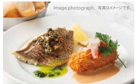
Today's Fish Plate with Bread 本日のフィッシュプレート (ブレッド付き) 1,800