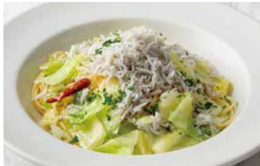
Whitebait & Cabage Alio e Olio 釜揚げしらすとキャベツのアーリオオーリオ 1,250