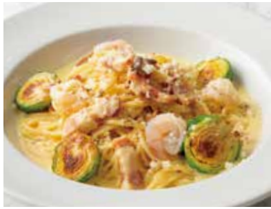
Carbonara with Pancetta, Shrimp & Brussels Sprouts 黒豚パンチェッタと海老、芽キャベツのカルボナーラ 1,400